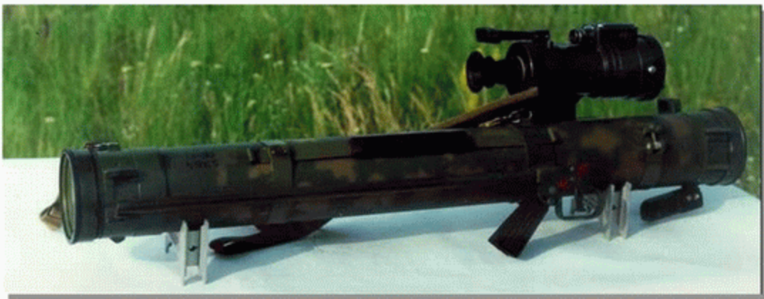
РПВ-А с з прицілом вогнеметника нічним ПВН