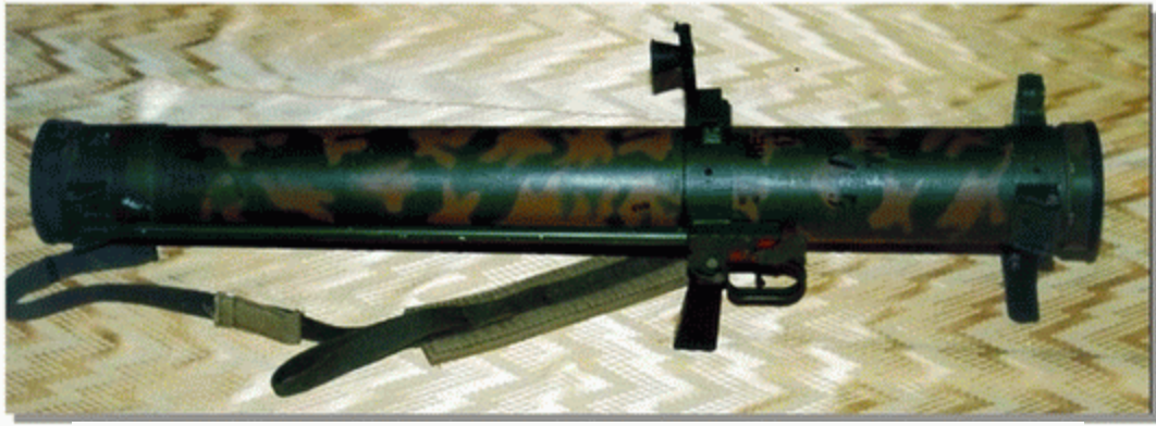
Реактивний піхотний вогнемет РПВ-А (З,Д)