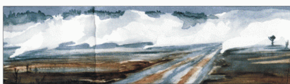
Осліплення димом вогневих засобів і спостережних пунктів противника груповим ужитком запально-димових патронів.