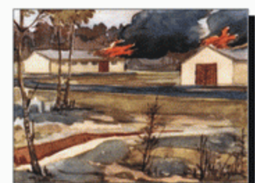
Підпал легкозаймистими матеріалами