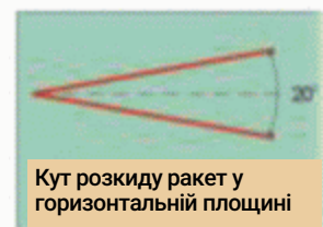
Кут розкиду ракет у горизонтальній площині

Перед пострілом необхідно послабити кришку з червоною міткою, патрон уперти уступом пускової трубки в антабку автомата, лівою рукою схопити ствол із патроном і тримати в напрямку цілі, правою рукою відгорнути кришку з червоною міткою, вивільнити шнур, узяти кінець шнура, обмежений кільцем, у праву руку, надати патрону з автоматом необхідний напрям і кут підвищення, здійснити правою рукою ривок шнура по вісі патрона.