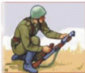
Постріл із положення з коліна