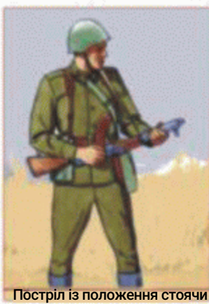
Постріл із положення стоячи